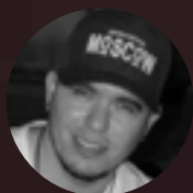
JUNIOR STYLE - MA Oficina de Danças Urbanas Iniciante